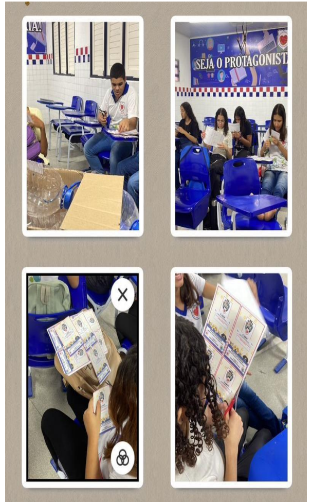
Figura 2. Recorte dos Panfletos