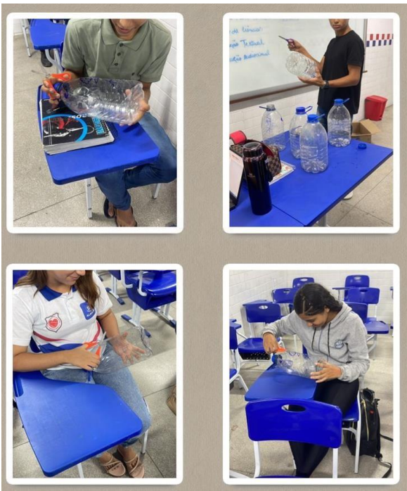
Figura 4. Construção de vasilhas

Alguns exemplares das vasilhas foram levadas pelos estudantes para suas casas, visto que alguns já fazem essa prática de todos os dias de alimentar e cuidar dos animais.