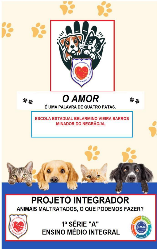
Figura 1. Modelo do Panfleto

https://palmeiradosindios.al.gov.br/entresaberespraticaseacoes/