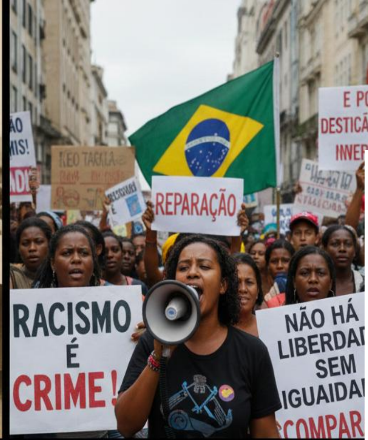
As imagens fazem referência ao Dia Nacional de Denúncia contra o Racismo e às Reflexões sobre a Abolição sem Reparação – (Imagens geradas por IA)