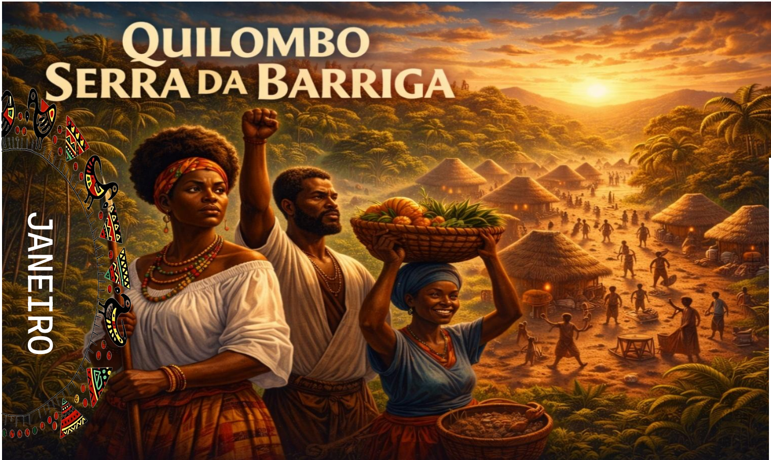
Imagem faz referência ao Quilombo dos Palmares, símbolo de resistência e protagonismo - (Imagem gerada por IA)