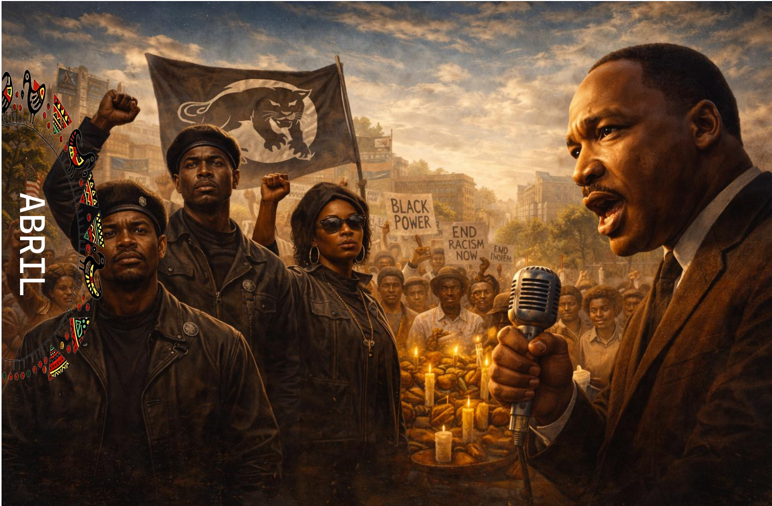
Imagem faz referência ao Partido dos Panteras Negras e a Martin Luther King - (Imagem gerada por IA)