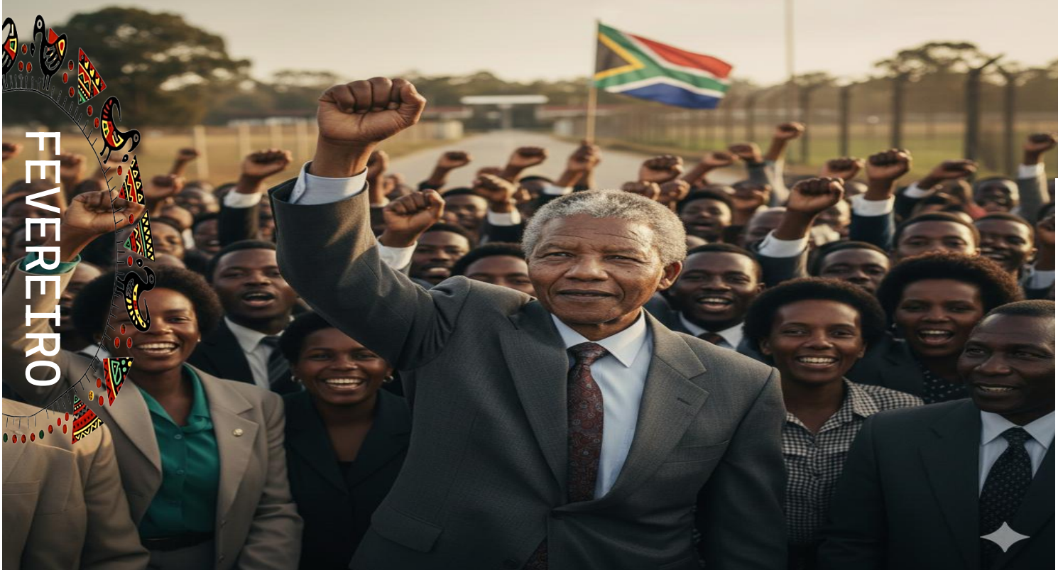
Imagem faz referência Libertação de Nelson Mandela - (Imagem gerada por IA)