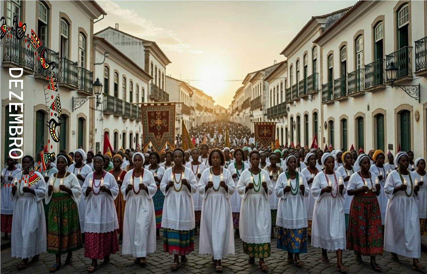
A Imagem faz referência ao Dia de Oxum – (Imagem gerada por IA)